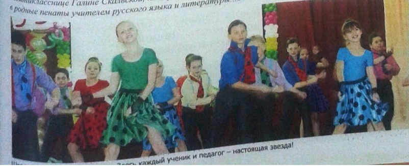
... Каждый ученик и педагог - настоящая звезда!